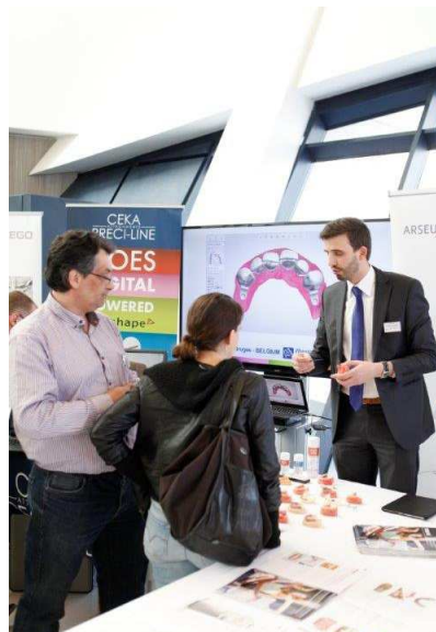
Figure 1 - Les participants aux Future Day reçoivent des conseils d'un spécialiste Arseus